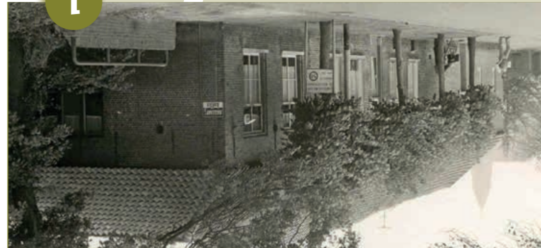
(voormalig) Café Zaal Burgerhout

In 1852 verwierf C.L. Dekkers de herberg genaamd Burgerhout voor 740 gulden van de bierbrouwersfamilie Van Gilse. Vele generaties bleef het café bezit nan de familie Dekkers. Destijds lag Zaal Burgerhout tamelijk buitenaf naast een turfvaart en langs een uitvalsweg richting Rucphen en Zundert. In de loop van de twintigste eeuw ging Burgerhout door de bouw van de Josephwijk en het Vrouwenhof deel uitmaken van de stad Roosendaal. Vanouds behoorde bij het café een schietbaan, lange tijd de thuisbasis van handboogschutterij 'De Oude Doelen'. Deze horecagelegenheid stond ook bekend als Café van Eekelen, naar de zaadhandelaar die hier tevens was gevestigd. In 2020 maakte Zaal Burgerhout plaats voor een appartementencomplex.